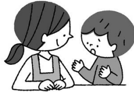
なや 悩みがあるとき そうだん 相談できる