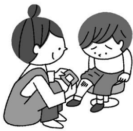
ケガをしたとき きゅうきゅうしよち 救急処置してもらえ