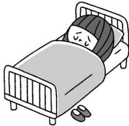
ぐあい わる 臭いが悪いとき いちじてき きゅうよう 一時的に休養できる