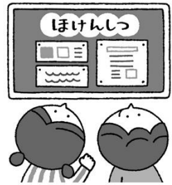
けんこう 健康について し 知りたいとき