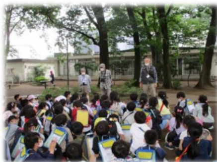
3年生 野川での学習