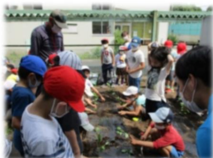
2年生 野菜の苗植え（教材園・ミニトマト）