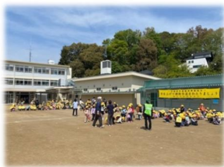
1年生 4月の下校サポート