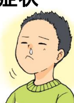
はなみず はな 鼻水・鼻づまり