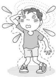
めまいや顔のほてり