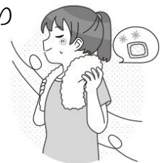
保冷剤や冷たいタオルで冷やす