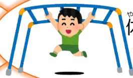
休み時間の運動遊び

※感染対策のため、マスクをはずしたときには、「人と十分な距離をとる」「会話をひかえる」ことを意識しましょう。