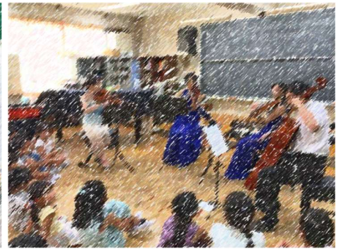
ヴァイオリン体験と音楽鑑賞