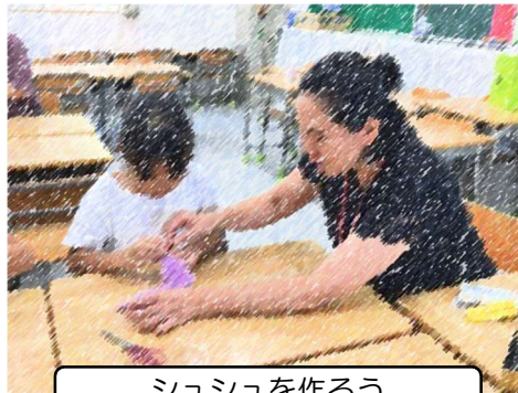
シュシュを作ろう