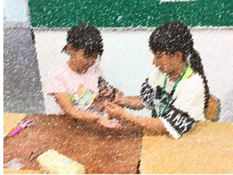
サンキャッチャー