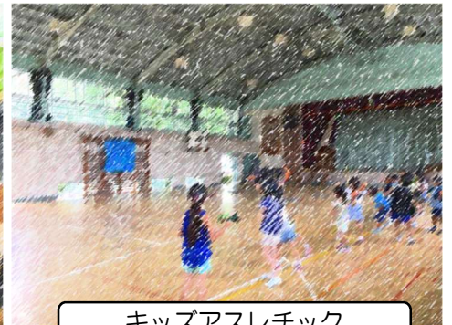
キッズアスレチック

上記の他にもたくさんの講座がありました。地域の方々、保護者の方々にご協力いただきまして、ありがとうございました。