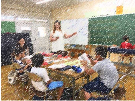
日本語で学ぶ英語の世界

7月29日（月）～8月2日（金）の5日間、「サマーチャレンジわかば」が行われました。今年も多彩な講座が開かれ、児童も多数参加し、大盛況でした。