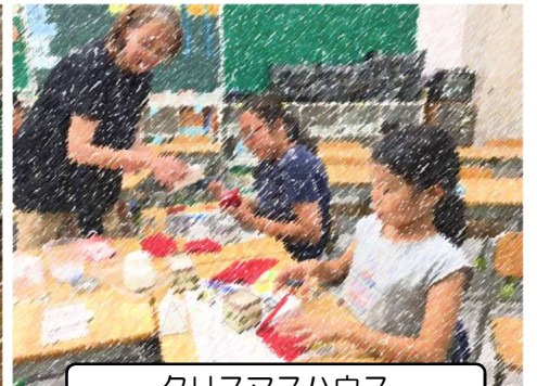
クリスマスハウス