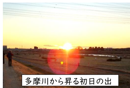
多摩川から昇る初日の出

令和6年を迎えました。元日の朝、「明けましておめでとうございます」と明るい気持ちで挨拶をしたのですが、夕方に石川県能登地方を震源とする地震が発生し、新年を迎えた明るい気持ちが一転しました。また、続く2日には羽田空港で事故が起こり、大きな飛行機が見る見るうちに激しく燃えていく様子が生中継で映し出されました。犠牲になられた方々にお悔やみを申し上げるとともに、地震により被災されたすべての方々に心よりお見舞い申し上げます。