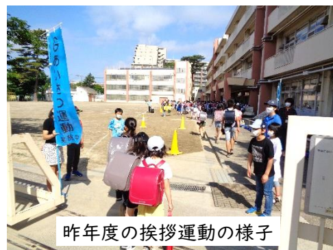
昨年度の挨拶運動の様子

私は、校門に立って挨拶をするとき、全員と挨拶することを心がけています。上ノ原小の子供たちだけではなく、神中生はもちろん、校門の前を通り過ぎるすべての人に挨拶をします。そのおかげで、毎日良いことはばかり起きて、楽しい日々を過ごすことができています。