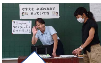
タブレットに向かって話し掛けている。

1つ目は、プログラミング教育への活用です。高度情報化社会がさらに加速する中、子供たちには、知識だけでなく生涯学び続ける力を身に付けさせることが求められています。そこで新しく採り入れられたことが、課題を順序よく筋道立てて