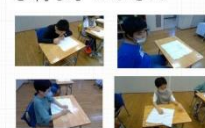
5・6年生で初めて縫い物に挑戦しました。