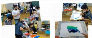
自分達で色紙を作って、貼り絵にしました。