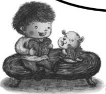
『ボチボチのとしよかん』 (井川ゆり子 文楽堂)より

図書館の本は 染地小学校の みんなのものです。 「返す日」をまもって、 大切に使いましょう!