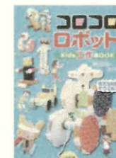
「ココロロボット Kids工作BOOK」 野出 正和//著 古川孝//著 いかだ社