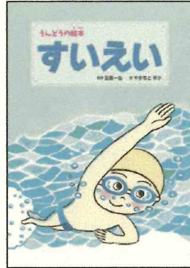
「すいえい うんどうの絵本2」 西園 一也//監修 やまもと ゆか//絵 あかね書房