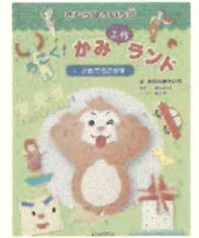
「3.とめてうごかす」 栢谷 めぐみ//製作 延近 萌//イラスト