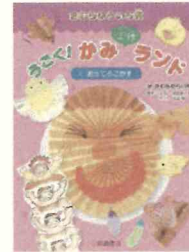
「1.おってうごかす」 栢谷 めぐみ//製作イラスト 延近 萌//カット