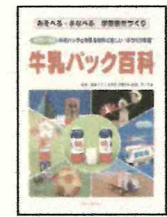
「牛乳パック百科」 宮下 英雄//監修 少年写真新聞社