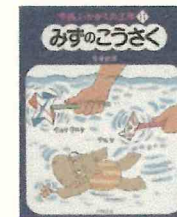
「やさしいかがくの工作1」 みずのこうさく」 竹井 史郎//著 小峰書店