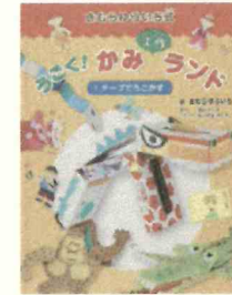
「2.テープでうごかす」 栢谷 めぐみ//製作 おくやま ひでとし//イラスト