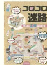
「ココロ迷路 Kids工作BOOK」 野出 正和//著白石 いかだ社