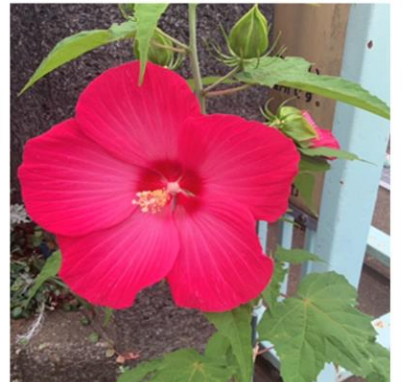
道行く人の目を引いていた アメリカフヨウの大輪の花

子どもたちに役立てるよう、また地域活性化に繋がるよう、ボランティアのみなさんの知識や知恵をお借りしながら活動しています。