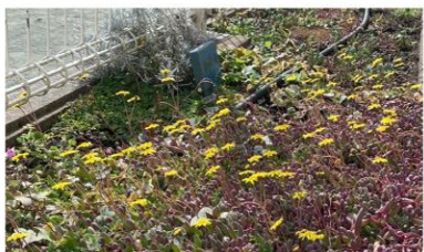
太陽に向かい元気に咲く 多肉植物の可愛い花