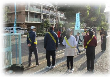
おやじの会の皆様と代表委員会児童であいさつ運動を行いました。

朝晩、冷え込んできました。感染症も流行りだしたようです。くれぐれも皆様ご自愛の上お過ごしくださいませ。