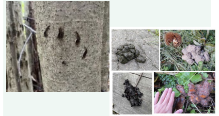
食べたもの：（上段左から）黒っぽい、クマ （下段左から）サクランボの果、カキ 「美の国あきたネット ツキノワグマ情報」より