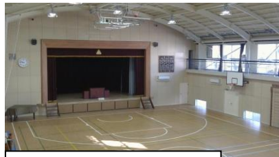
LED照明や冷暖房機器が整備されました。