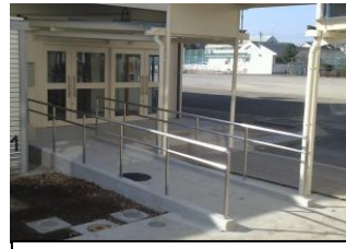
スロープ（入口前）や多目的トイレの設置によって、バリアフリー化が進み、誰でも使いやすい施設になりました。