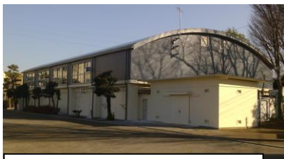
白と紺色の外観が特徴的です。

昨年12月に体育館の改修工事が完了しました。3学期には、久しぶりに子供たちの元気な声が体育館に響き渡ることでしょう。