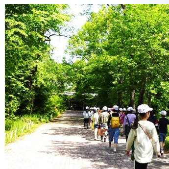
植物多様性センター