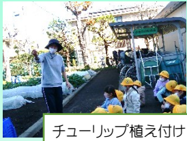
チューリップ植え付け