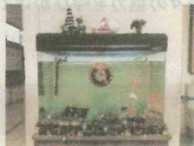
水槽のクリスマスデコレーション