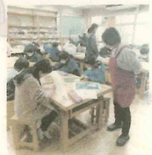
図工の授業の見守り

地域と共に開かれた学校である為に、多くの地域の方々の協力を呼びかけて、この活動の輪が広がって行く事を願っています。