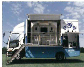
スターツCAMの起震車