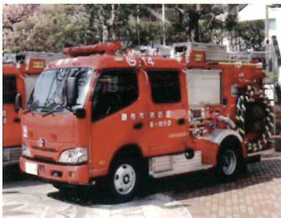
第14分団の新ポンプ車