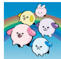
人権キャラクター「えぶりわん!」

本校は、令和5・6年度東京都教育委員会人権尊重教育推進校として、様々な取組を推進しているところです。その一環として、人権課題である北朝鮮による拉致問題を学習します。