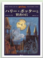
8/31 (水) 魔法ゼリー 「ハリー・ポッターと賢者の石」

大人気、ハリー・ポッターシリーズの第1巻です。魔法ゼリーは、この本をイメージした献立です。6月にも実施しましたが、当日、お休みに食べられなかったお友達のために「もう一度、出してあげてください。」と、優しいお友達がリクエストしてくれました。