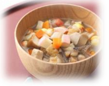
9/28 (水) だぶ

だぶは福岡県の行事食として食べられています。お祝い事の際には材料を四角に切り、玉葱が用いられるそうです。