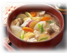
9/26 (月) さつまいものめった汁

さつまいもの入った具沢山みそ汁です。名前の由来は「めったに食べられない、豚肉が入った汁物」や「やたらめったら具を入れる汁物」など、諸説あるそうです。