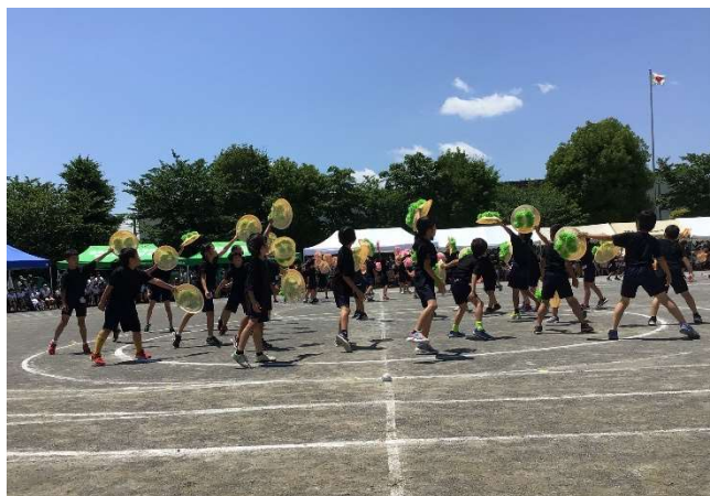
5・6年「フラッグ~それぞれの道~」