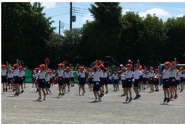
1・2年「レッツ!ジョイフル!!」