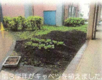
第3学年がキャベツを植えました。

4月には、新たに校内にも畑を一つ作りまして。第2学年と学童の間の土地を利用して、用務主事が耕しました。すでに学習用の野菜の苗が植えられています。チョウがいい具合に飛んできてくれると、一層学習が深まります。が、こればかりは自然のもつ流れに従うしかございません。「そんなこともある」とそこから学ぶこともあります。学童の入口付近ですので、お迎えにいらっしゃる保護者の方、どうぞ注意してお進みください(横切ろうとすると畑に入ってしまう)。