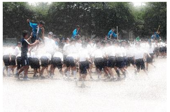
1年学年種目 いかだながし