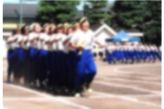
3年学年種目 おおむかで