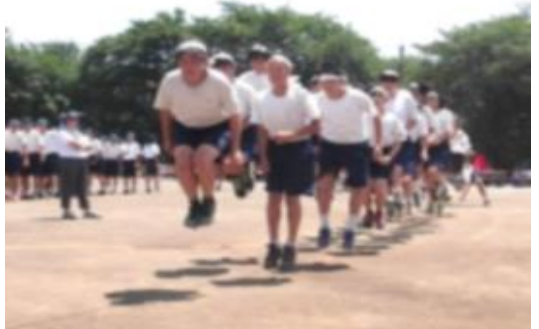
2年学年種目 大縄飛び