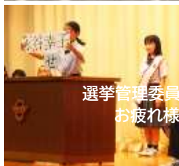
選挙管理委員会の生徒の皆さん お疲れ様でした！(^^)!