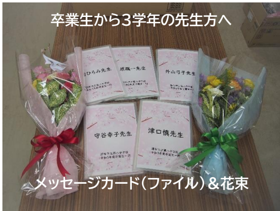
メッセージカード(ファイル) & 花束