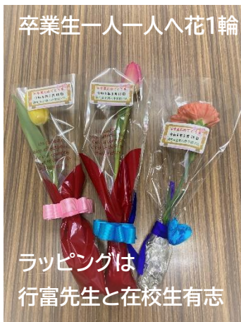
ラッピングは 行富先生と在校生有志