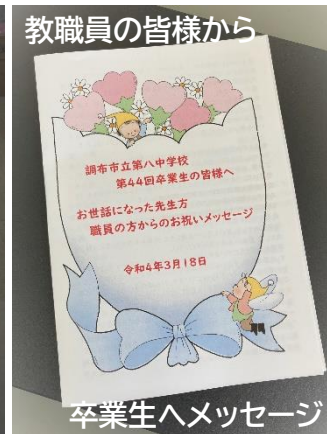
卒業生へメッセージ