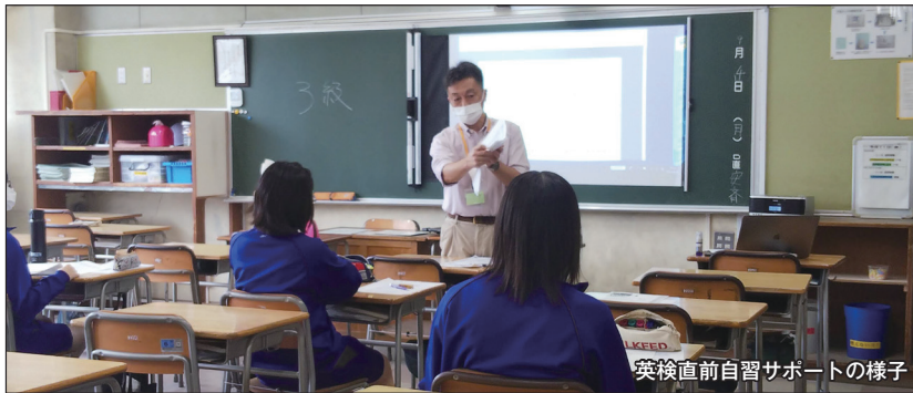
英検直前自習サポートの様子

調布市には、令和2年度現在、六中を含め24校に設置されていて、学校の行事、部活動（中学校）、図書館や花壇などの環境整備、そして授業や放課後・週末の学習など、校長の学校経営方針に沿って学校を支援しています。その支援のための活動に、PTA、高齢者、学生、NPOや民間企業団体など、地域から幅広い人たちがボランティアとして参加し活躍していただけるよう、各校の地域コーディネーターが活動します。