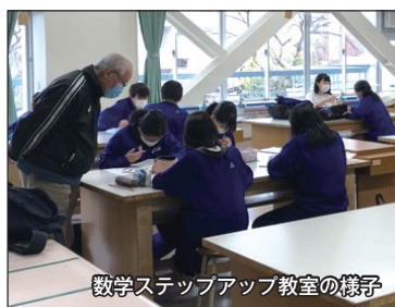
数学ステップアップ教室の様子

六中地域コーディネーターへの連絡方法 mail : chofu6-gakosien@chofu-schools.jp