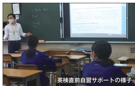
英検直前自習サポートの様子