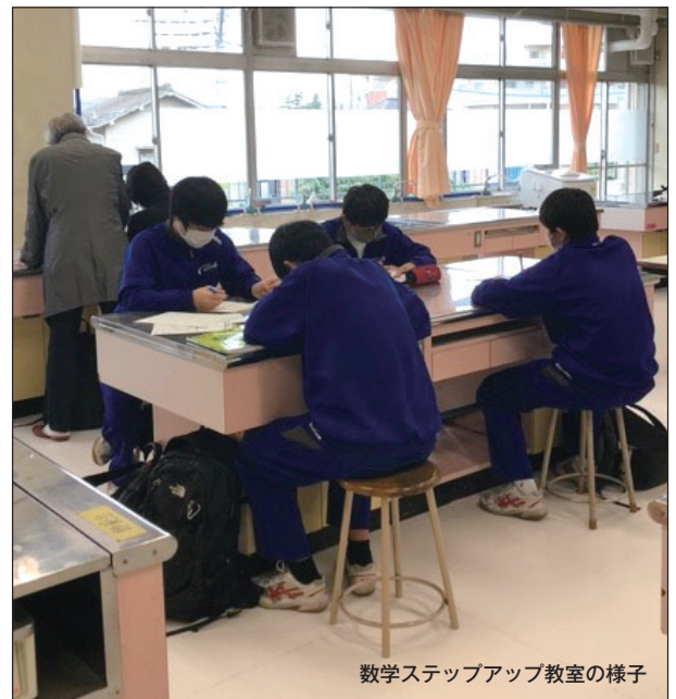
数学ステップアップ教室の様子