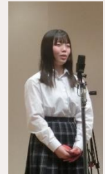
実行委員長の言葉