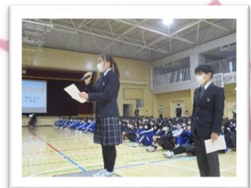
3年生ありがとうキャンペーン