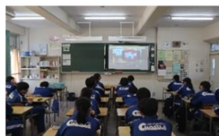
薬物乱用防止教室