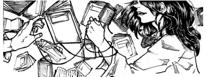
イラスト 烏 mask