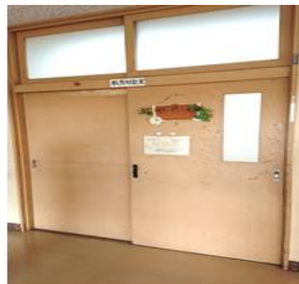
相談室入口（T ルームの隣）