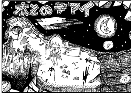
2年 空想のみじんこ(ペンネーム)