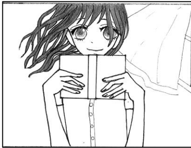
2年 スイートポテト(ペンネーム)

期間：12月8日(木)～22日(木) 貸出冊数：8冊まで(クローバーカードなどを獲得している人は10冊まで) 返却期限：1月13日(金)