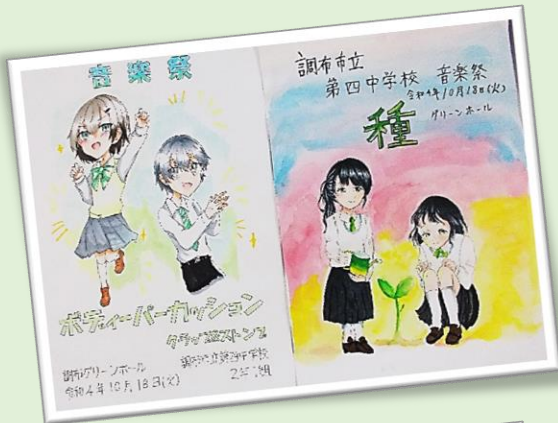
2年生 クラスポスター