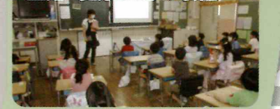
生活・健康教育の取組

自分を大切にすることを身に つけてほしいとの願いから、養 護教諭やカウンセラーが中心 となり、心と体の健康教育につ いて取り組んでいます。