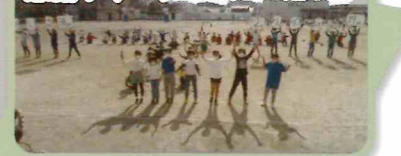
感謝ウィーク(6年生を送る会)

各学年が色々な企画を考えて、 お世話になった6年生に感謝 の思いとエールを送ります。