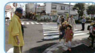
春・秋の交通安全運動