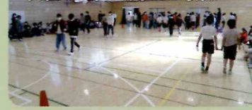
福祉や国際理解への取組

様々な立場の外部講師からお話 をしていただくことで、児童は 他者理解を深め、共生する力を 培っています。