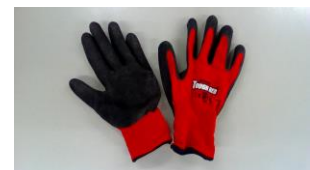
※写真1 作業用ゴム軍手例