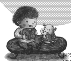
『ポチポチのとしよかん』 (井川ゆり子 文溪堂)より

図書室の本は 第三小学校の みんなのものです。 「返す日」をまもって、 大切に使いましょう！