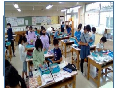
家庭科と3年生音楽でICTを活用した取組