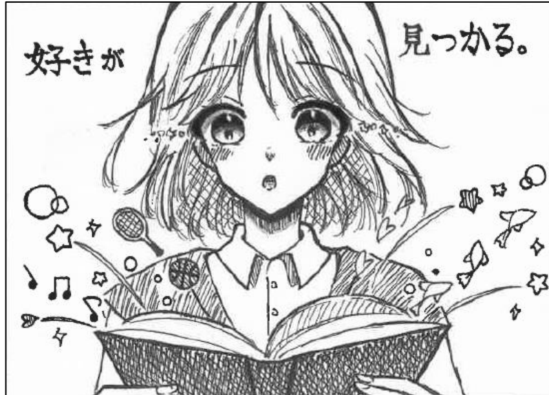
神代中・きのこのこ（ペンネーム）

本との・・・本当の・・・出会い・・・本との・・・本当の・・・出会い・・・本との・・・