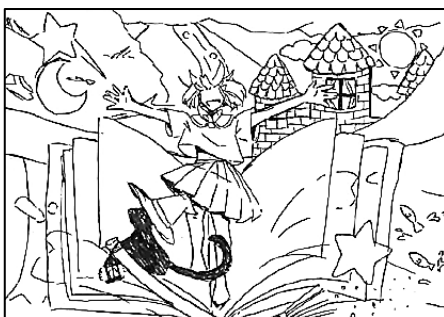
第五中・だれだろね (ペンネーム)