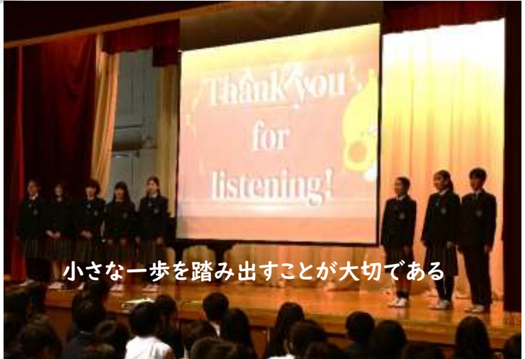
小さな一歩を踏み出すことが大切である