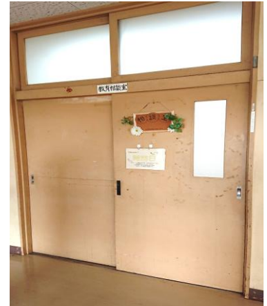
相談室入口（T ルームの隣）