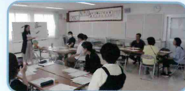
ケヤッキーとのだんらん